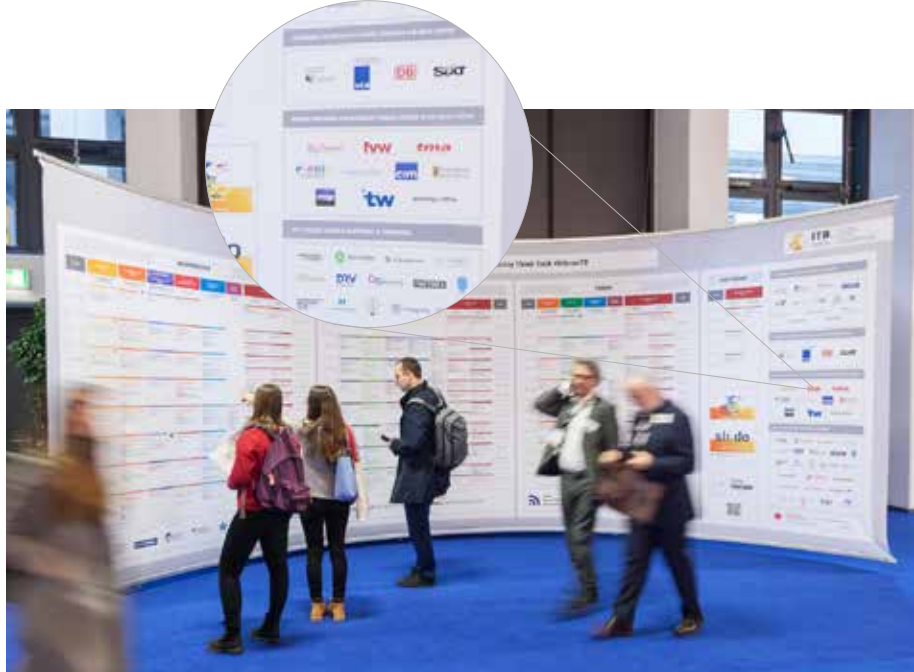
Aufmerksamkeitsstark: Ihr Sponsoren-Logo auf den Programmwänden im Kongressbereich