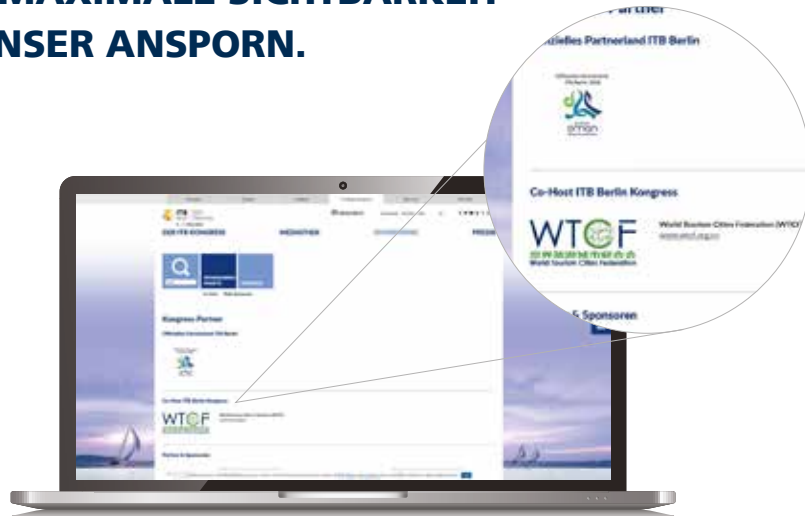
Aufmerksamkeitsstark: Ihr Sponsoren-Logo auf der ITB Berlin Kongress Website

Der Kongress findet zum 17. Mal im Jahr 2020 statt.